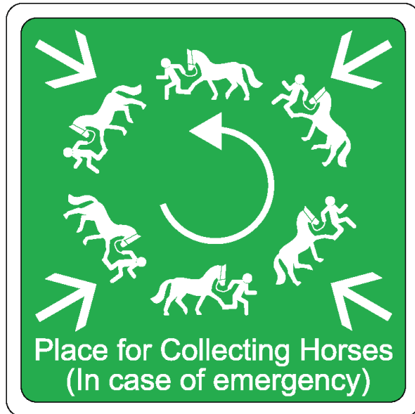
Sammelplatz zu Führen evakuierter Pferde